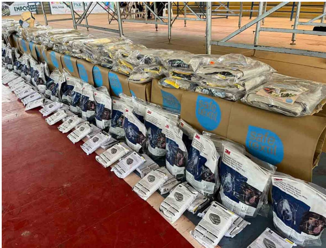
Prendas de vestir terminadas y las características de las confecciones de seguridad.

Con el objetivo de cuidar el medio ambiente y, paralelamente, generar empleo formal, la empresa Safe Textil incursionó en la confección de trajes de seguridad con nanotecnología destinada para las labores del sector agricultor.